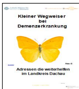
2. Ausgabe August 2016