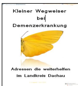
1. Ausgabe Juni 2015