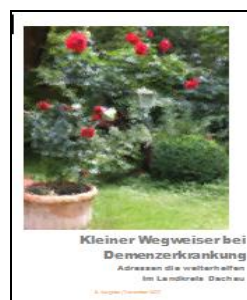
3. Ausgabe Dezember 2017