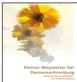
4. Ausgabe Juni 2021